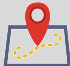
J. Laboral (c/sentencia): Duracion Total del Proceso

Por ello, ya es Ley la Comisión Permanente de Mapa Judicial para contar con información actual y real .